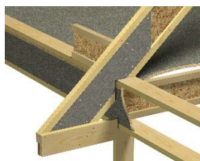
T03-450 Forsterket garp i utstikk.