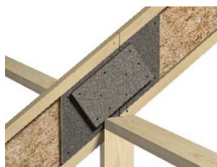
T03-460 Forsterket garp over midtopplegg. Sperren deles og skjøtes.