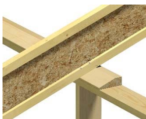
T03-610 og 611 Opplegg på skrå svill i utstikk og midtopplegg