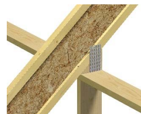
Med tilgang til spikerplatepresse kan kile festes til sperren med spikerplate.